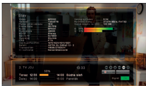
Takto máte jasný prehľad o tom, ako je na tom váš prijímač, kvalita signálu a pripojený externý disk