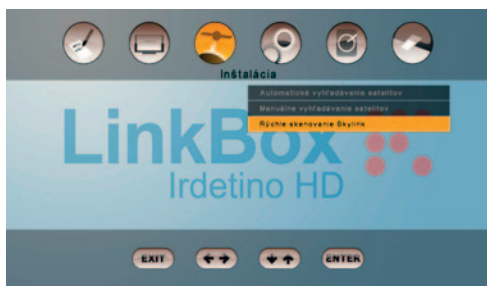
Vynikajúca vlastnosť je rýchle vyhľadanie – zariadenie naozaj nájde stanice podľa našich predstáv, navyše veľmi rýchlo