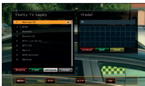
Hľadanie stanice aj v dlhom zozname je jednoduché – stačí zadávať písmená hľadaného názvu